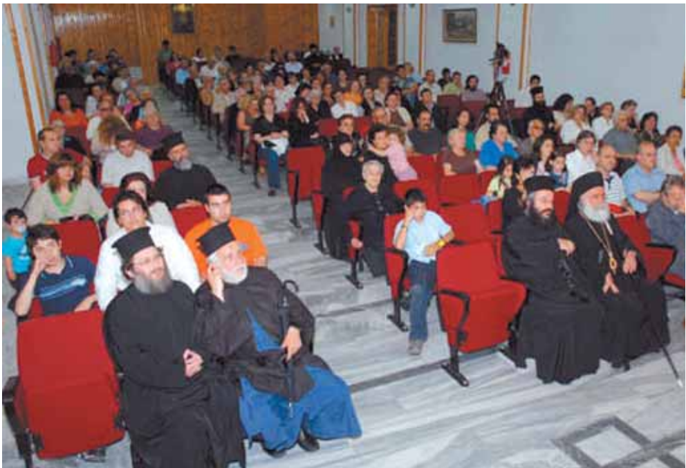
Ἐκ τῆς ἐκδήλωσης γιὰ τὴν Ἑλπίδα τῆς Πόλης.