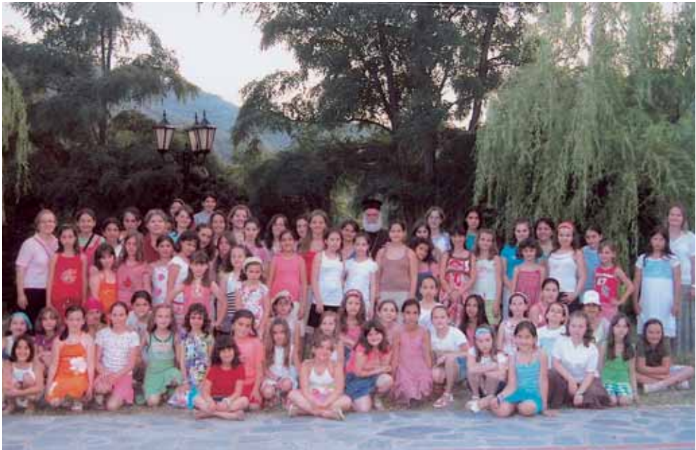
Ἐκ τῆς πρώτης Κατασκηνωτικῆς περιόδου τῶν Κοριτσιῶν στὸν Ἅγιον Γεώργιο Δρυμιᾶς.