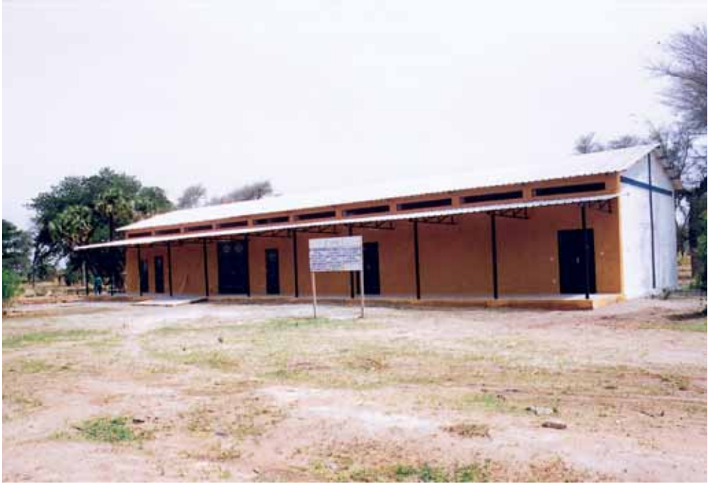
Ο προσφάτως αποπερατωθείς χώρος Πολλαπλών Χρήσεων στο Ίεραποστολικό Κέντρο του Κατράνγκ στο Β. Καμερούν.