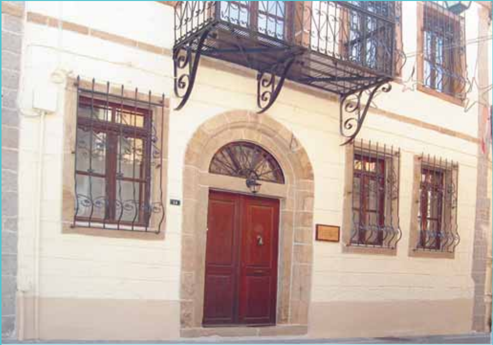
Ἀπὸ τὰ Ἐγκαίνια τῆς Ἐκκλησιαστικῆς Βιβλιοθήκης.