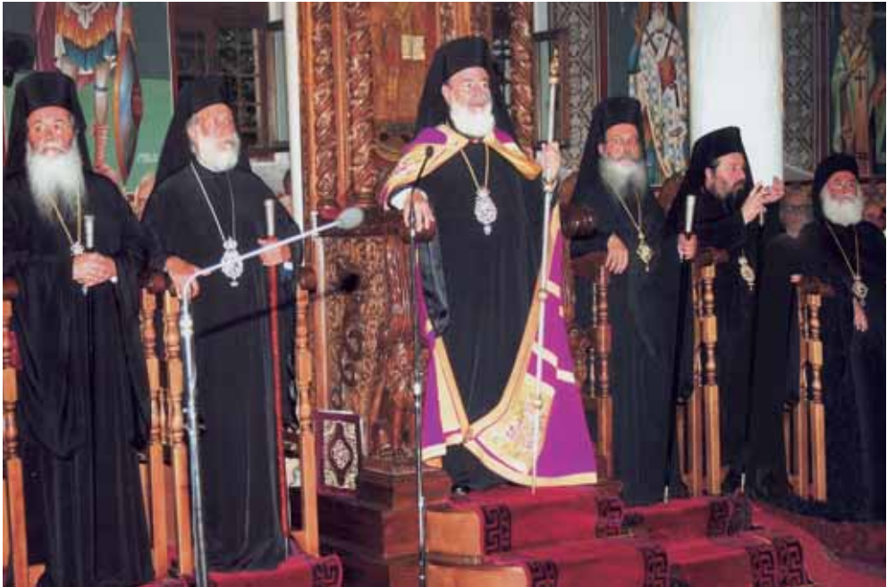
Ἀπό τόν ἐόρτιο Ἑσπερινό τοῦ πολιοῦχου Τιμίου Προδρόμου, χοροστατοῦντος τοῦ Μακαριωτάτου Ἀρχιεπισκόπου Ἀθηνῶν καί πάσης Ἑλλάδος κ.κ. Χριστοδούλου.