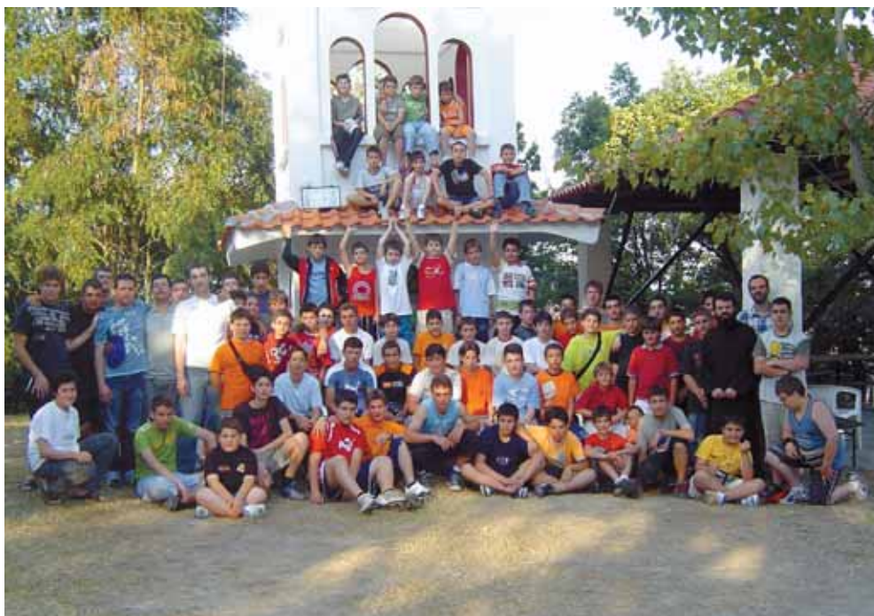
Άπό τίς κατασκηνώσεις τῆς Ἱερῶς Μητροπόλεως.