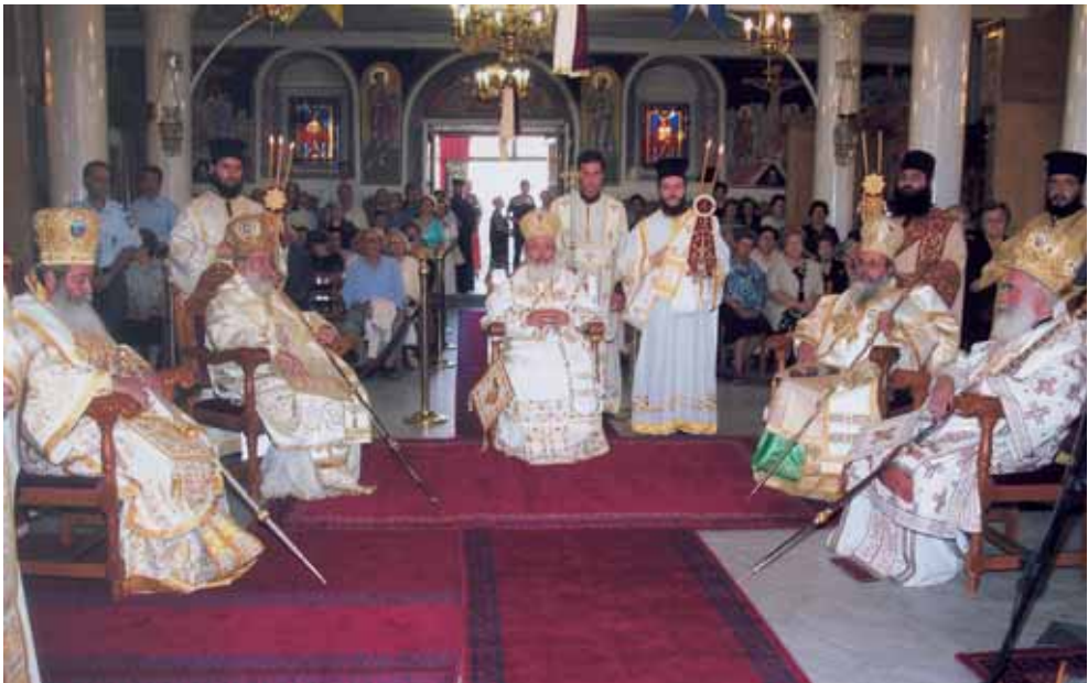
Θεία Λειτουργία στόν πανηγυρίζοντα Ἱερό Μητροπολιτικό Ναό, προεξάρχοντος τοῦ Μακαριωτάτου Ἀρχιεπισκόπου Ἀθηνῶν καί πάσης Ἑλλάδος κ.κ. Χριστοδούλου.