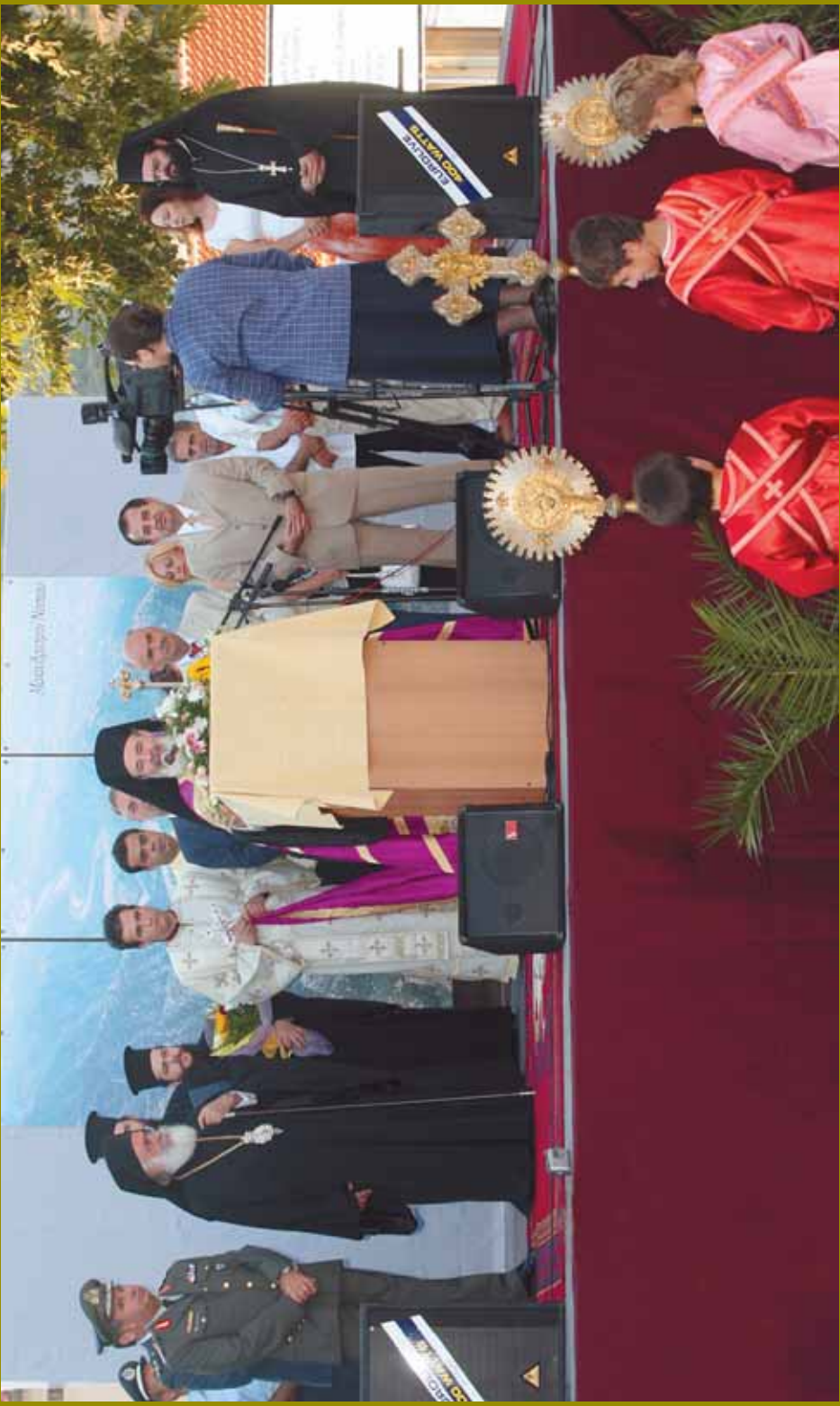
Ἀπό τὴν ὑποδοχὴ τοῦ Μακαριωτάτου Ἀρχιεπισκόπου Ἀθηνῶν καὶ πάσης Ἑλλάδος κ.κ. Χριστοδούλου στὴ Σταυροῦπολη.