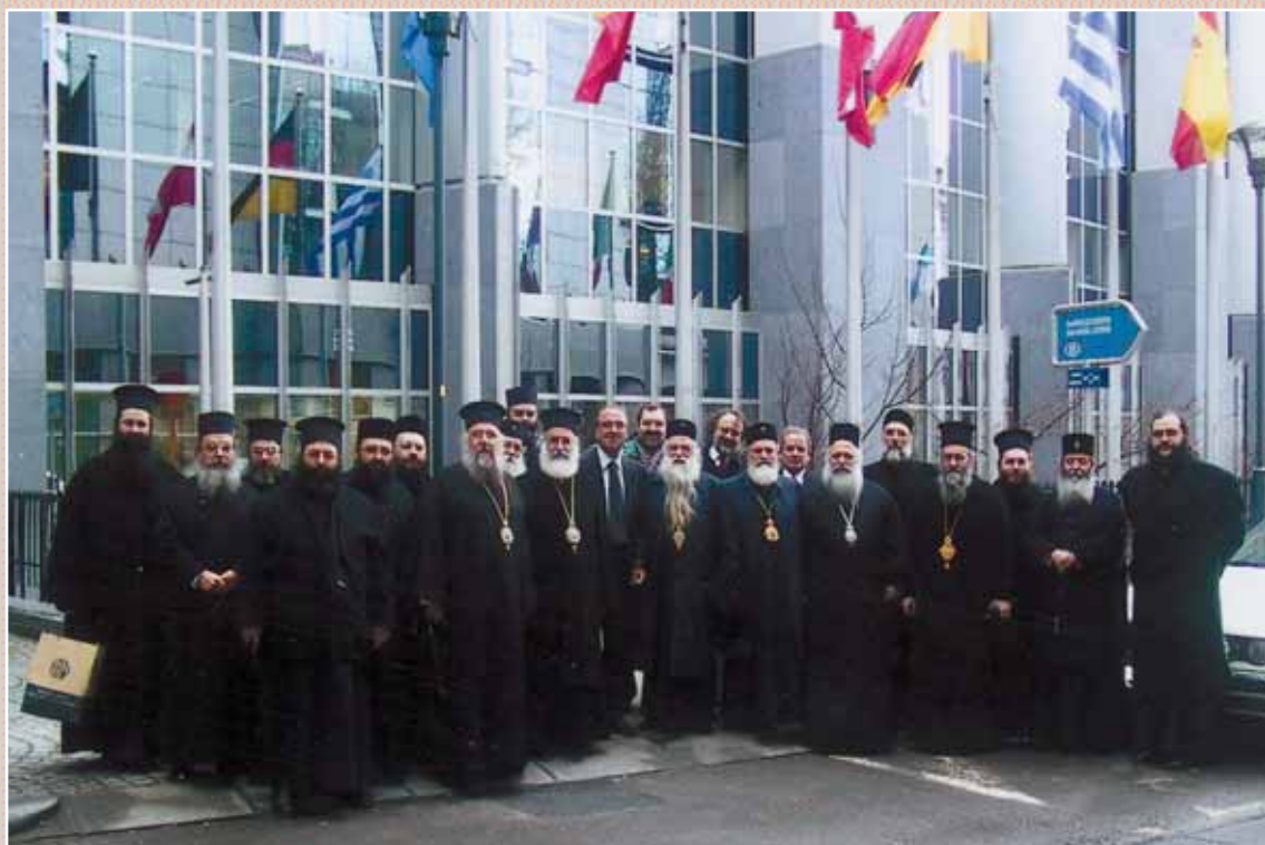
Άπό την επίσκεψη τῆς Εὐρωπαϊστολῆς στό Εὐρωπαϊκό Κοινοβούλιο καί στόν Πρόεδρο Patric Cox