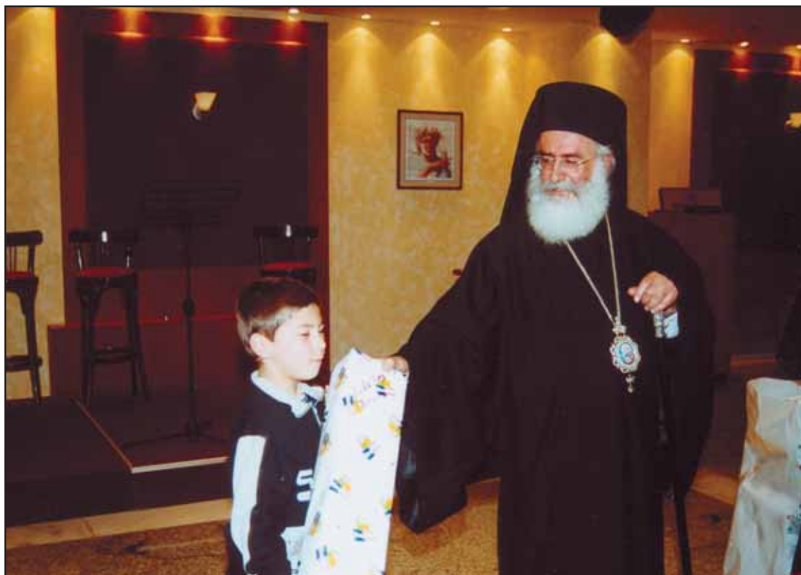
Ὁ Σεβασμιότατος Μητροπολίτης μας με τὰ παιδιά τῶν κληρικῶν.