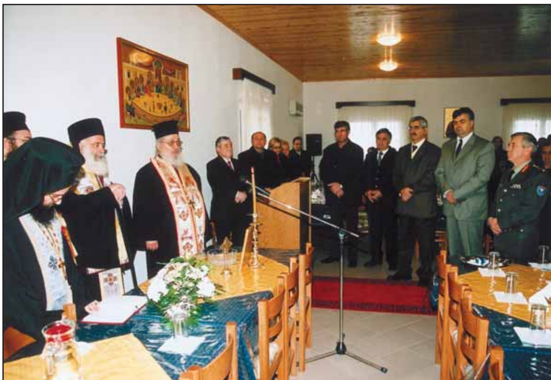
Ἀπὸ τὰ ἐγκαίνια τοῦ πνευματικοῦ κέντρου τῆς ἐνορίας Ἁγ. Πέτρου-Παύλου Πτεινοῦ